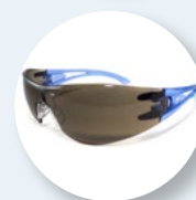
Também existe modelo castanho solar e clear anti-embaciamento: marcação FT