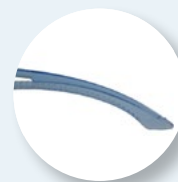
Hastes de dupla injeção