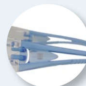
Hastes de dupla injeção para maior conforto